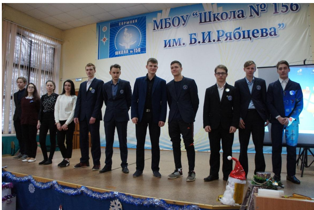
Победители школьного ГТО