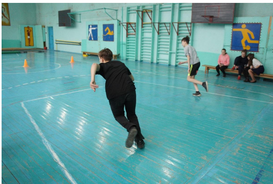
Челночный бег 3x10