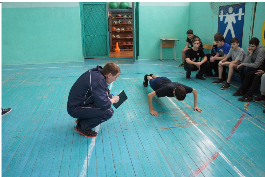
Сгибание рук в упоре лежа на полу.