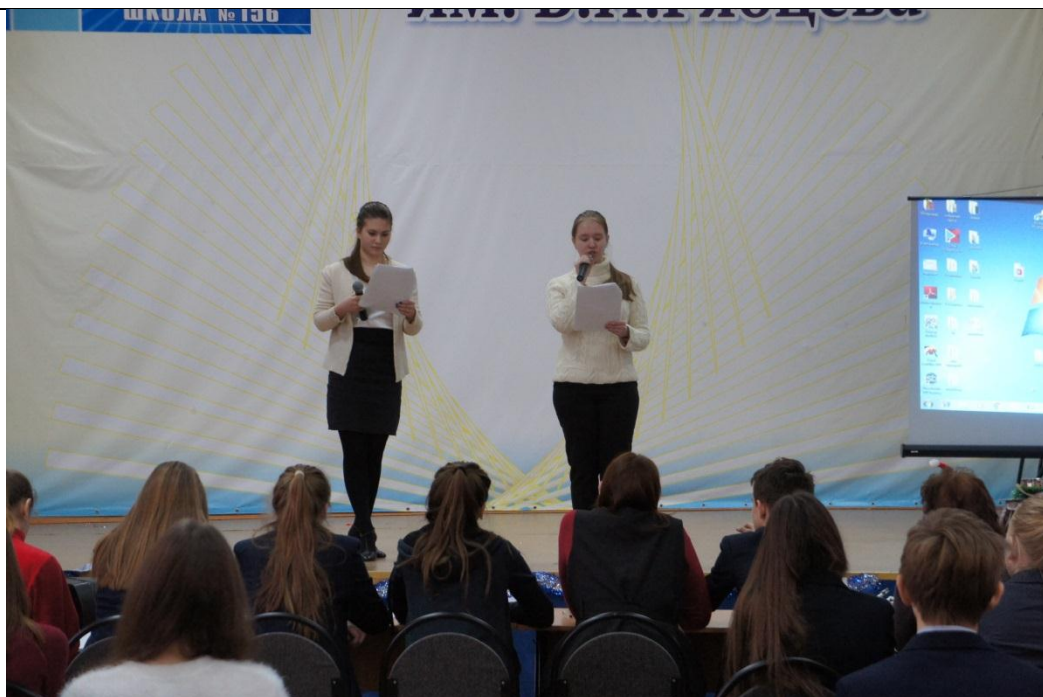
Конкурс сценариев «Что такое ГТО?»