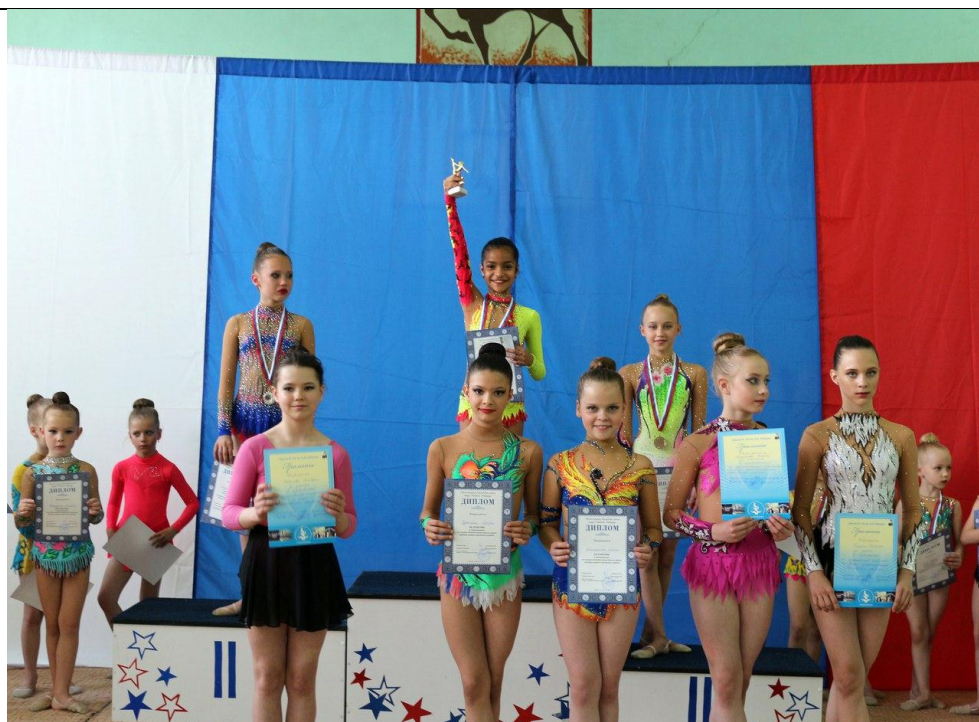
Торжественная церемония награждения