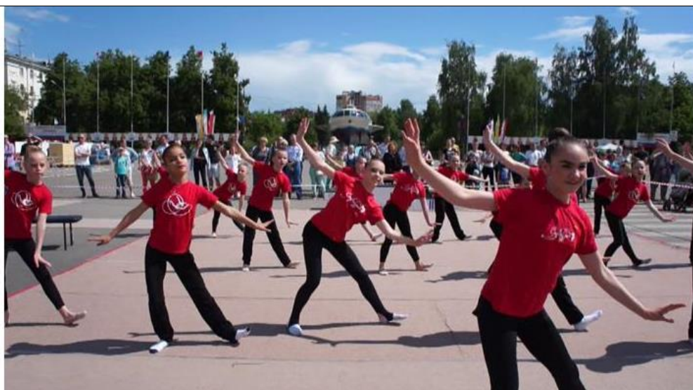
Показательное выступление «Вверх, вниз»